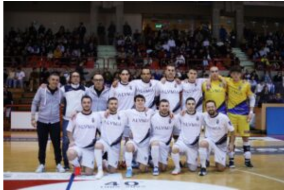
La Nuova Juventina seconda

rimonta che si rivela cruciale per fissare il punteggio al termine del primo tempo.