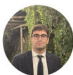
di Giacomo Grasselli

Presso la sala del Consiglio Comunale del Comune di Jesi saranno effettuati i sorteggi della kermesse organizzata dallo Jesi dal 4 al 7 gennaio 2024