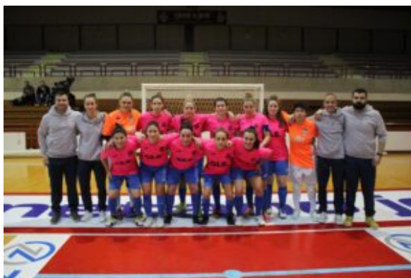
La Gls Dorica Torrette Mantovani

Il capitano argentino segna cinque reti e, insieme al definitivo e sfortunato autogol che porta il punteggio a 11-4, asfalta definitivamente la Nuova Juventina, facendo procedere la coppa in direzione Camerino. Per i bianconeri, ancora una volta, nulla da fare in finale. Dopo esser stati sconfitti l'anno scorso a Pesaro dal Cagli, il vademecum maledetto resta il medesimo, anche se per la squadra di Montegranaro resta la soddisfazione di rappresentare la nostra regione alla fase nazionale di Coppa Italia Serie C. È il Gagliole, per la prima volta nella sua storia, la regina delle Marche.