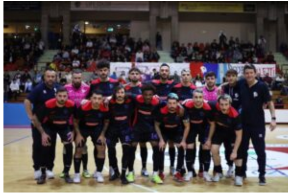
Il Gagliole campione